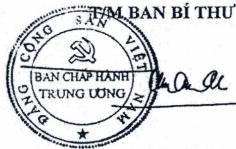
Trương Thị Mai